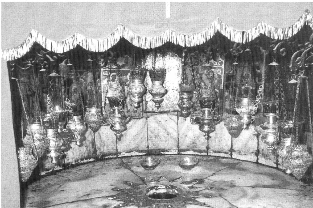
Der Silberstern in der Geburtsgrotte zu Bethlehem, wo ständig Öllampen brennen.

und trotzdem ein guter Christ sein kann. Allerdings sollte man keinesfalls mit Verachtung auf diese alte Überlieferung schauen. Denn schon um 150 n. Chr. wird von der Geburt Jesu in einer Grotte erzählt. Man kann diesen Hinweis auf die Grotte als legendenhafte Ausschmückung der Geburtserzählungen verstehen, muss aber davon ausgehen, dass solchen schriftlichen Zeugnissen schon eine Zeit der mündlichen Überlieferung vorausgeht, so dass das Motiv der Höhlengeburt in jedem Fall eine sehr, sehr alte Tradition aus einer Zeit ist, in der die Spätschriften des Neuen Testaments vielleicht noch gar nicht niedergeschrieben waren. In und um Bethlehem gibt es eine ganze Menge von Höhlen, die wohl in biblischer Zeit oft als Unterstand für die Hirten und für das Vieh dienten, so dass eine Verbindung mit der Krippe im Lukasevangelium durchaus sinnvoll erscheint.