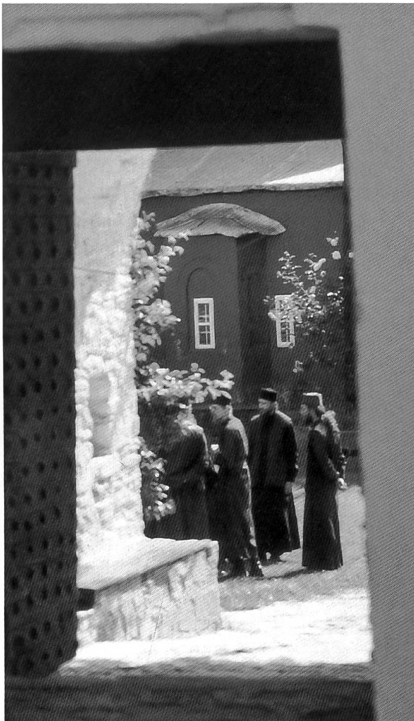
Junge Mönche im Kloster Philotheou.

zeichnet. Manche sehen leidend aus, vermischen eine Freundin oder einen Freund, fühlen sich einsam, ringen mit dem Sinn. Manche haben Heimweh. Beim Russenkloster erbetelte ein junger Mönch von uns eine Telefonkarte, ging vor unseren Augen zur nahen Telefonkabine und telefonierte freudig strahlend heim nach Russland. Die Mönche im fortgeschrittenen Alter strahlen Erlösung aus. Sie haben die Kämpfe der Leidenschaften und Ängste bestanden. Da gibt es manche gütige Väter mit einer ungeheuren Ruhe und Einfachheit. In den Industriestaaten sprechen wir von der «vaterlosen Gesellschaft», weil bei uns die Väter fern von den Kindern an der Arbeit oder im Club sind. In der Orthodoxie liefert die Religion den Menschen Väter. Sie strahlen