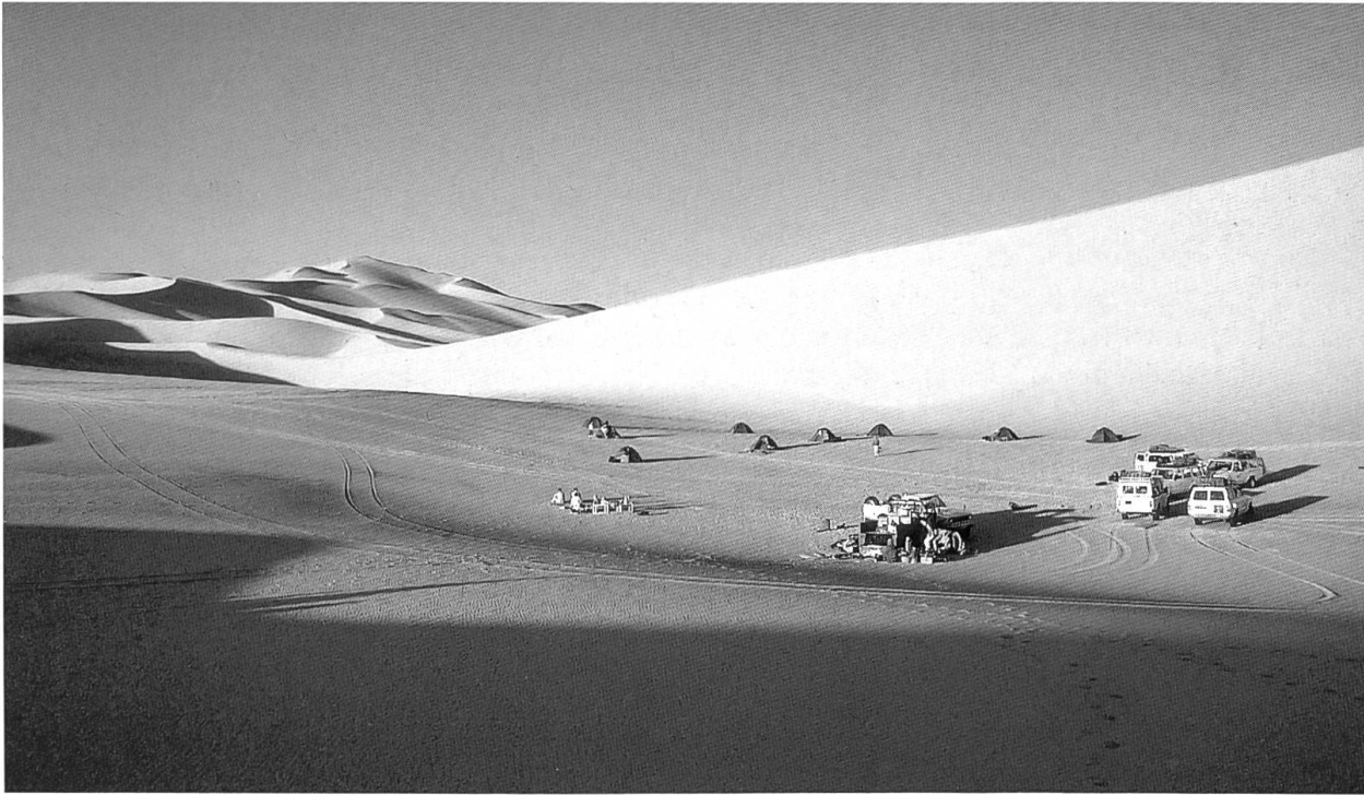
Camp in den Dünen vor der Stadt Ghat, der einzigen grösseren Oase im Südwesten Libyens, am Fuss des Jdinen-Gebirges.

Wie jede Nacht verklingen auch heute am Lagerfeuer die monotonen Lieder der Tuareg; Melodien, auf die ich mich jeden Abend freute, die auch heute in mir nachklingen und so manche Wüstenbilder lebendig erhalten.