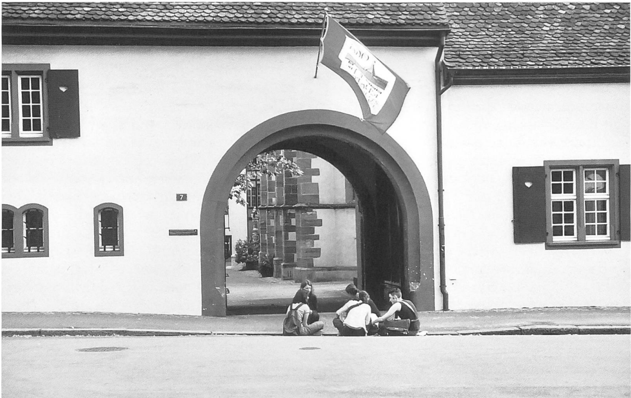
Junges Leben in alten Mauern: Blick vom Theodorskirchplatz in die vor 600 Jahren gegründete Kartause. Während der Reformation aufgehoben, dient sie seit 1669 der Stadt Basel als Waisenhaus.

und Nonnen. Doch galt in der Gesellschaft der Grundkonsens, dass das Ordensleben sinnvoll und auch für die Gesellschaft nützlich sei. Im Verlauf des Spätmittelalters sollte sich das ändern: Die Reformation bündelte die bereits vorhandene Kritik an der alten Kirche und ihrem Ordenswesen und rechtfertigte sie theologisch. Das Ordensleben verschwand aus der Stadt. Erst nach der Französischen Revolution, als die Katholiken in der Stadt zahlreicher wurden und sich mehr und mehr integrierten, kam es in Basel wieder zu Niederlassungen von Orden und Kongregationen. Diese waren ganz auf die tätige Nächstenliebe, auf Schule, Krankenpflege und Mithilfe in der Seelsorge ausgerichtet. Aber viele Menschen suchen heute wieder spirituelle Vertiefung und Stille. Vielleicht wird eines Tages in der Stadt wieder eine klösterliche Gemeinschaft leben, die das Kontemplative und Mystische betont, das dem Mittelalter so wichtig war.