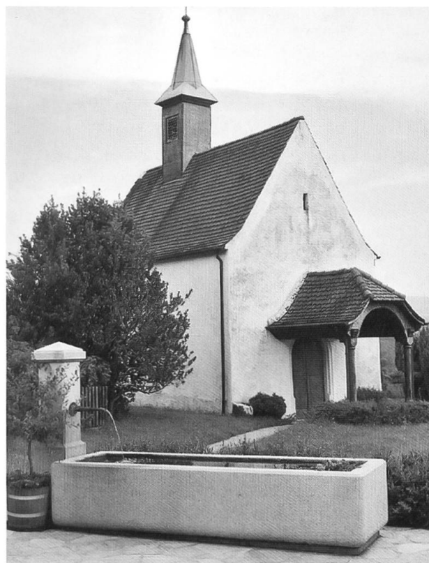
Die Wendelinskapelle in Kleinblauen (1666) zeigt auf dem Altarbild den Heiligen (rechts) zusammen mit dem hl. Eligius und der Muttergottes.

selfränkische Raum, aber auch das rhein-mainfränkische Gebiet, ferner Oberalemannien und Schwaben, dazu die Bistümer der Schweiz und jene von Innsbruck und Feldkirch in Österreich. Im Bistum Basel werden 115 Orte aufgeführt, wo dem hl. Wendelin Ehre erwiesen wurde und wird. Im Bistum Chur sind es deren 72, im Bistum St. Gallen zehn und im Bistum Lausanne-Genf-Freiburg drei, im Bistum Sitten schliesslich fünf. – In der Nordwestschweiz fand der hl. Wendelin im Laufental und im solothurnischen Schwarzbubenland grosse Verehrung. Erwähnt sei die Schlosskapelle auf Burg Angenstein beim Ausgang des Laufentals, die dem hl. Wendelin und der hl. Mutter Anna geweiht ist. In Kleinblauen steht eine viel besuchte Wendelinskapelle. In Brislach liess die Pfarrei 1937 in der Lourdeskapelle durch den einheimischen Künstler August Cueni ein Bild des hl. Wendelin anbringen. In Dittingen steht am Pilgerweg nach Mariastein