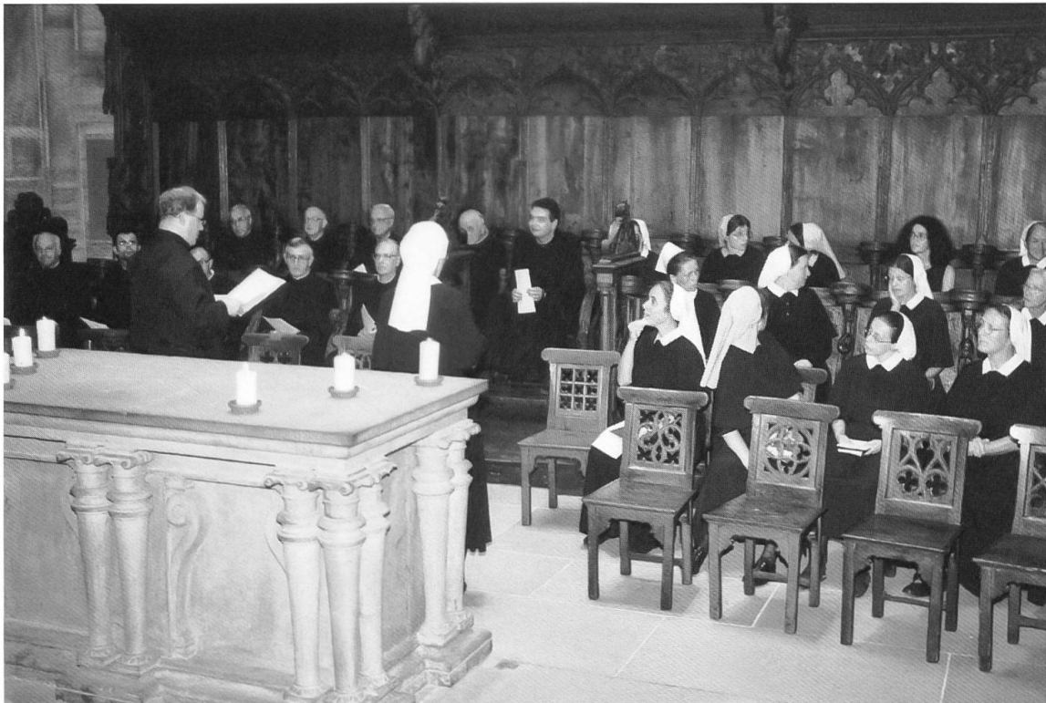
Ungewohnte Gäste im Altarraum des Basler Münsters: Die Diakonissen von Riehen und die Benediktiner von Mariastein während des Einsingens anlässlich der Vesper am 18. August.