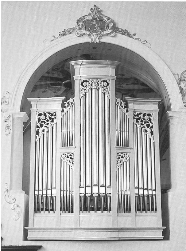
Am 22. November gedenkt die Kirche der hl. Cäcilia, der Patronin der «Musica Sacra». – Das Bild zeigt den Prospekt der neuen Chororgel.

dass Menschen, die in der Fremde alt und krank geworden sind, Gottes Nähe erfahren und Mitmenschen finden, die sie begleiten.