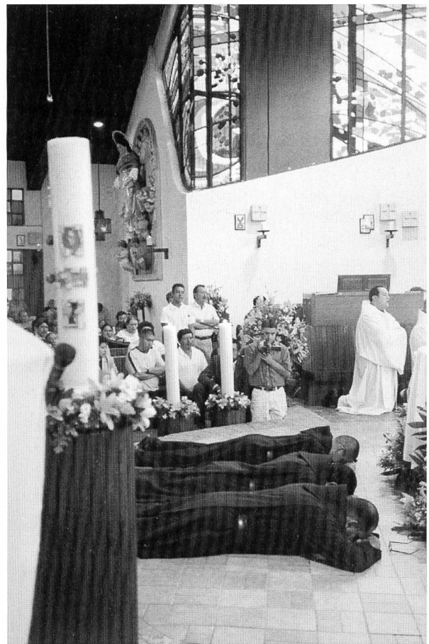
Drei junge Männer legen in der Kirche von «Nuestra Señora de los Angeles» ihre feierliche Mönchsprofess ab – für Mexiko, wo erst vor 60 Jahren die ersten Benediktiner eintrafen, ein Akt von grosser Tragweite.

Wir rechnen nicht damit, dass unsere klösterliche Gemeinschaft jemals sehr gross sein wird. In Mount Angel waren einige von uns gewohnt, mit siebzig anderen Mönchen zusammenzuleben, unter einem Dach mit Seminaristen und Gästen. Hier in Nuestra Señora de los Angeles könnte das eher kleine Grundstück Platz und Lebensraum bieten für 20 bis 25 Mönche. Je nach dem, wie sich die Gemeinschaft personell und ideell entwickelt, wird sie der Ortskirche, der Diözese von Cuernavaca, einen kleinen Dienst erweisen durch religiöse Unterweisung, geistliche Begleitung und Gastfreundschaft für die zahlreichen Besucher. Doch notwendig ist vor allem die Heran-