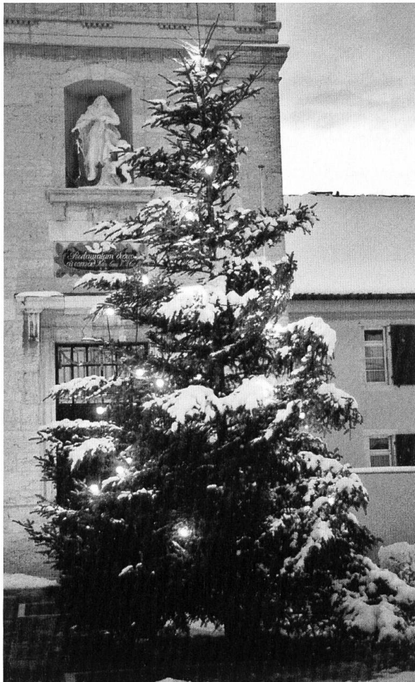
Weihnachtliche Stimmung vor der Mariasteiner Basilika