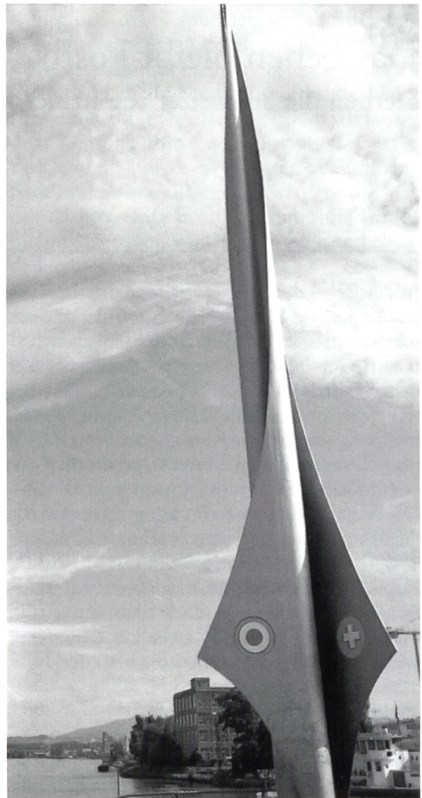
Symbol für den Berührungspunkt dreier Länder im Rheinhafen Kleinhüningen (Basel)

Ich gehe davon aus, dass bei einer Wiederholung auch die Grenzregion des hinteren Leimentals mit unserem Kloster nicht mehr aussen vor gelassen wird, nur weil wir zum Kanton Solothurn gehören. Schliesslich ist gerade der Wallfahrtsort Mariastein für viele Menschen im Dreiländereck ein ganz wichtiges, grenzüberschreitendes, religiöses Zentrum.