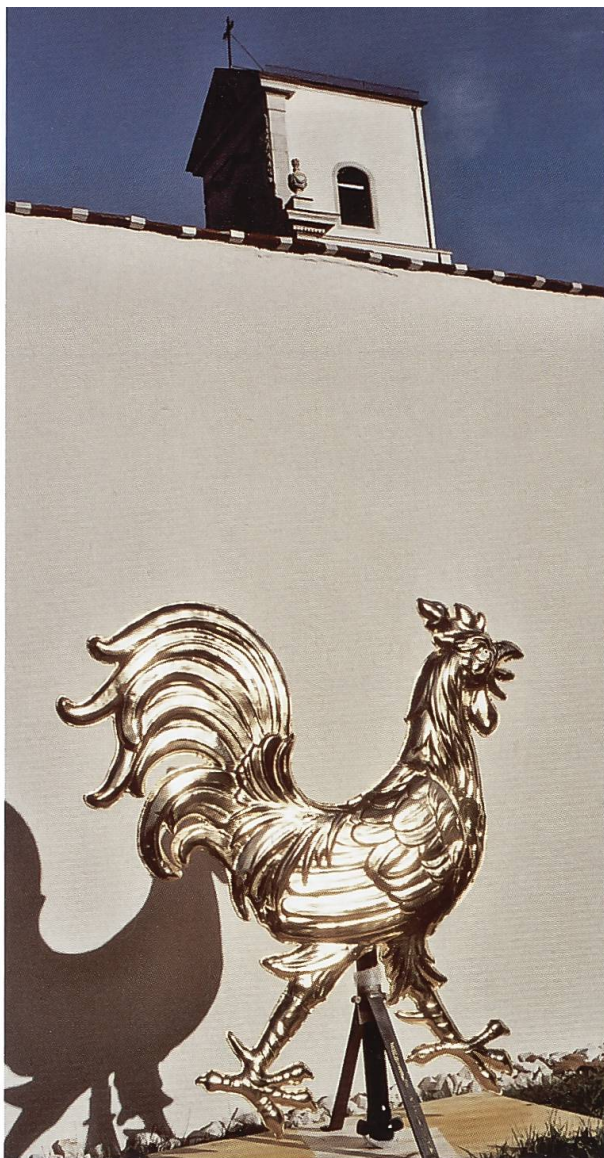
Der neue Mariasteiner Turmhahn, kurz vor der Montage. Er misst 111 x 105 x 12 cm und wiegt 7 kg. Vergoldet wurde er von der Firma Muff (Sursee).

Anders waren die Menschen in der Antike und in den ersten christlichen Jahrhunderten