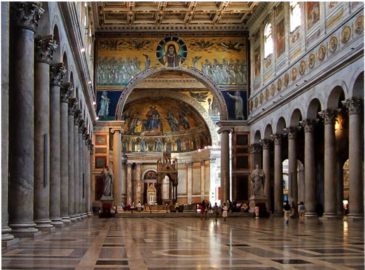
S. Paolo fuori le mura (St. Paul vor den Mauern), Inneres der Basilika.

Der erste christliche Kaiser Konstantin liess an allen drei Orten eine Wallfahrtskirche errichten: am Vatikan St. Peter, an der Via Ostiense San Paolo fuori le mura (basilica Sancti Pauli apostoli) und an der Stelle der heutigen S. Sebastiano die damals so bezeichnete Basilica Apostolorum. Anscheinend war allerdings die Basilika für den heiligen Paulus zunächst klein und bezeichnete den inzwischen verehrten Ort der ersten Bestattung. Unter den nachfolgenden Kaisern scheinen die Reliquien der Apostelfürsten wieder an den Ort ihres Martyriums gebracht worden zu sein. Jedenfalls wurde unter den gemeinsam