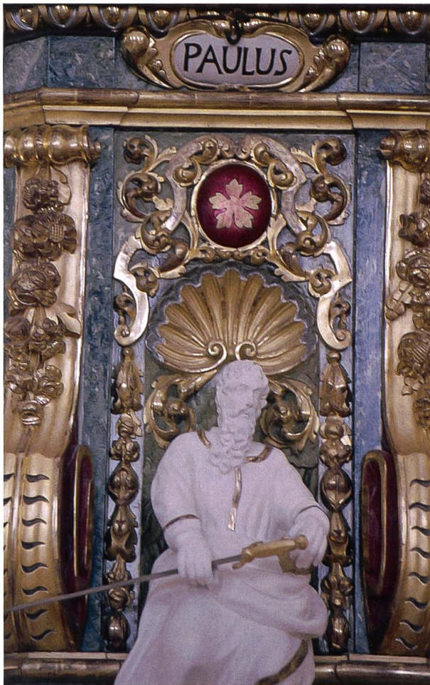
Der Völkerapostel Paulus an der Kanzel in der Klosterkirche Mariastein.