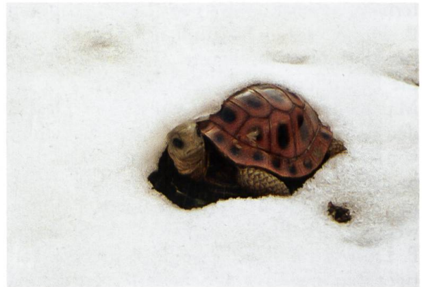
Doch im Februar wartete das «Chröttli» um- sonst auf die Schneeschmelze.