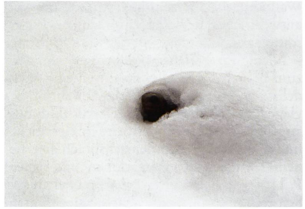
Im November und Dezember verschwand es zeitweise vollständig unter der weissen Pracht.