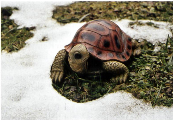
Und auch der März zeigte sich von seiner win- terlichsten Seite.