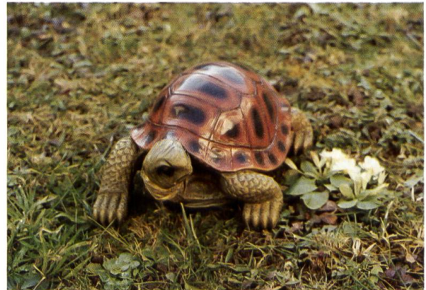
Selbst dem April traut unser «Chröttli» nicht... der «Weisse Sonntag» steht erst noch vor der Tür!