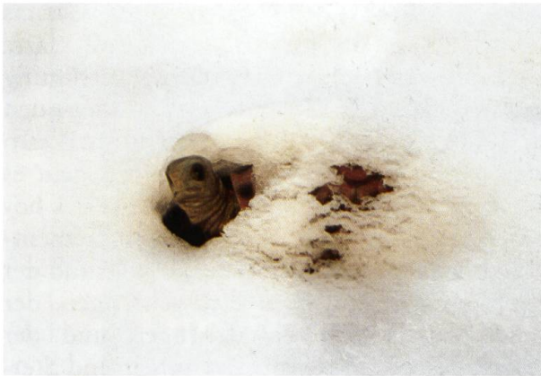
Dass es im Januar neuen Schnee gab, gehört zur Jahreszeit.