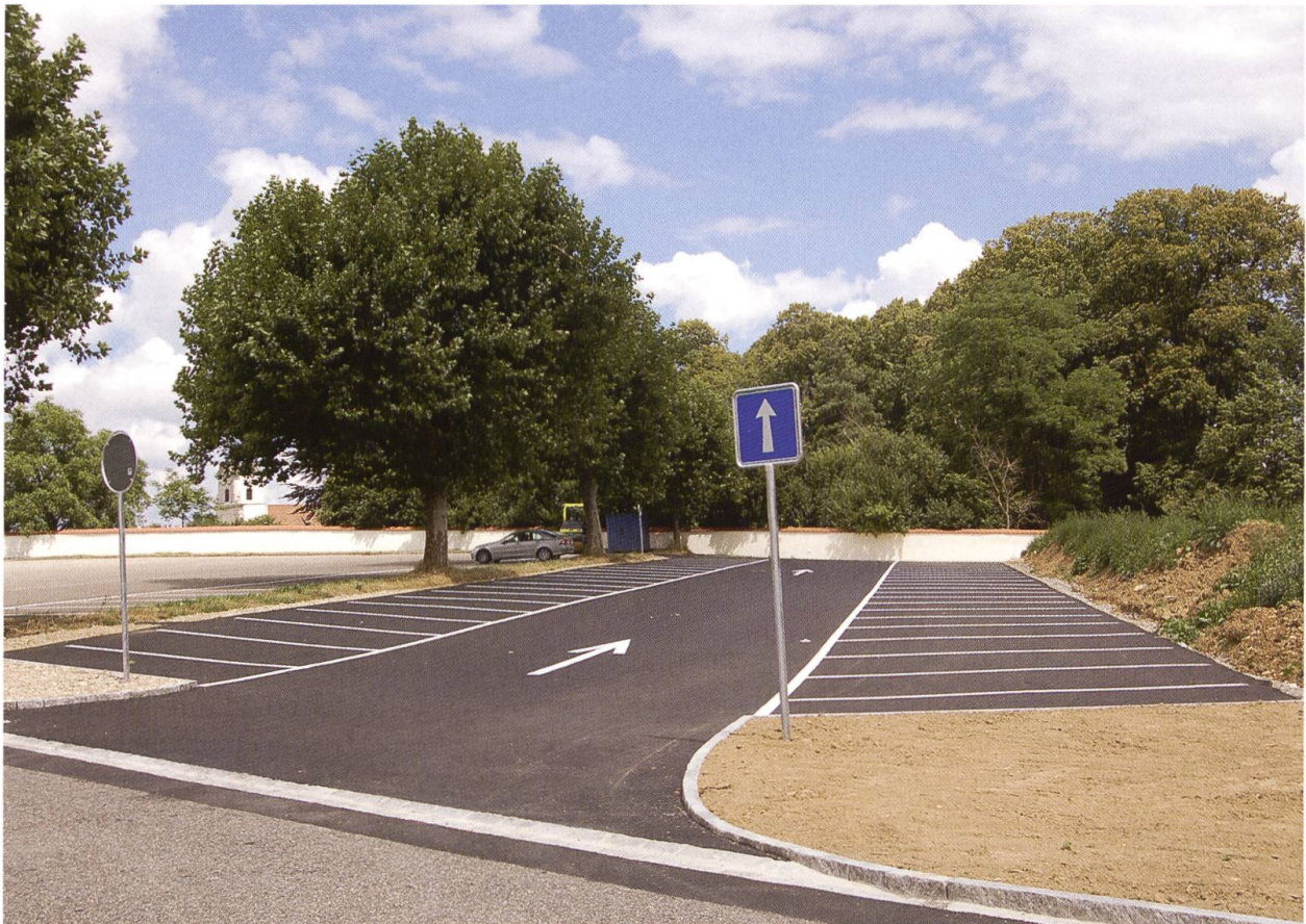
Neue Parkfelder vor der Klostermauer: Diesen Sommer hat das Kloster den grossen Parkplatz für die Pilger am Ortseingang vergrössert. Unseren geschätzten Pilgern steht dort auch weiterhin gratis Parkraum zur Verfügung.