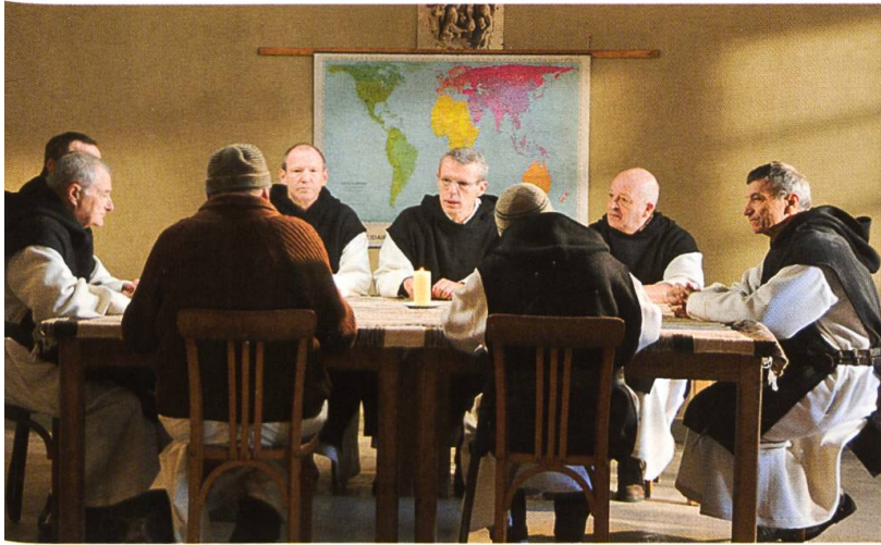
Lebenszeugnis: Die Trappistenmönche von Tibhirine ringen um eine Entscheidung, ob sie in Algerien bleiben sollen. Szene aus dem Film «Des hommes et des dieux» («Von Menschen und Göttern») von Xavier Beauvois.

ten-Mönche des algerischen Klosters Tibhirine, die im Frühling 1996 Opfer einer brutalen Gewalttat geworden sind. Das dramatische Schicksal dieser kleinen Mönchsgemeinschaft, die ihre Berufung darin sah, mitten in der islamischen Bevölkerung durch ihre demütige Präsenz vom Evangelium Zeugnis zu geben, wurde erst kürzlich einem weiten Publikum bekannt durch den preisgekrönten Film «Des hommes et des dieux». Mehrere Mitbrüder haben sich den Streifen im Kino angesehen und waren ergriffen und tief beeindruckt, nicht nur von der grossartigen schauspielerischen Leistung, sondern auch von dem harten Ringen, das die Trappisten schliesslich zum Bleiben bewog und zur Lebenshingabe befähigt hat.