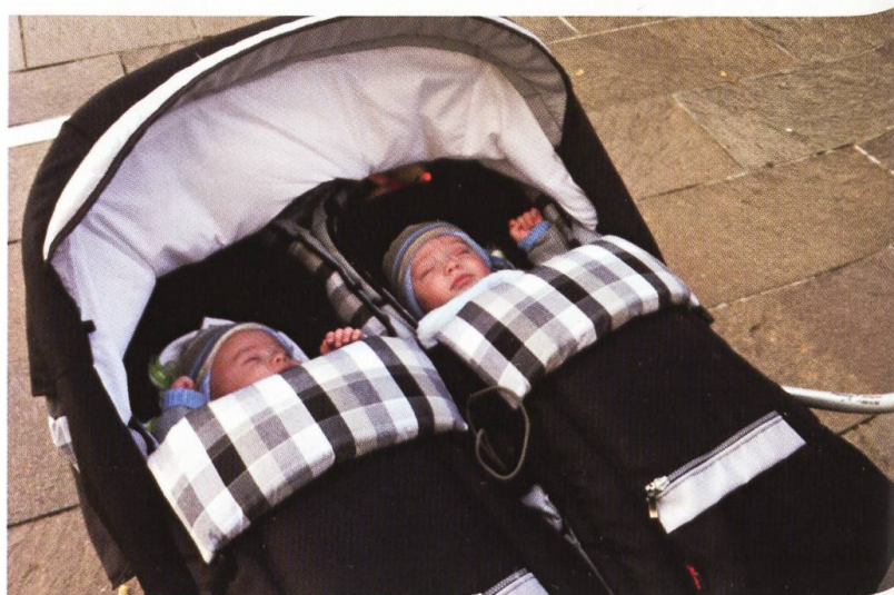
Zwei ganz junge Pilger aus Istein (D).

Begegnungen gabs auch am Abend des 28. November, als der Konvent sich nach der gemeinsamen Vesper zum Mitarbeiteressen ins Kurhaus Kreuz begab. Es war die Gelegenheit, unsere pensionierten Angestellten wiederzusehen, die teils von weither – etwa aus dem Diemtigtal – gekommen waren. Gleichzeitig war es der Moment, unseren Mitarbeiterinnen und Mitarbeitern Dankeschön zu sagen für ihre treuen Dienste, ohne