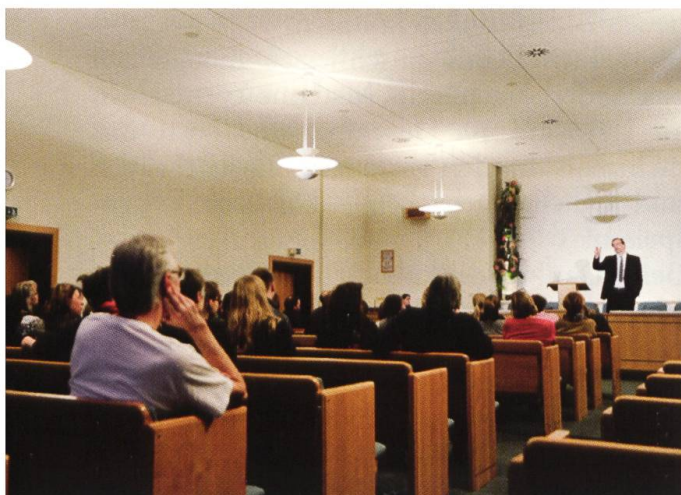
Das Projekt «How To Win Friends & Influence People» in der Mormonenkirche Freiburg i.Br. 2013 (vgl. Infos rechts).