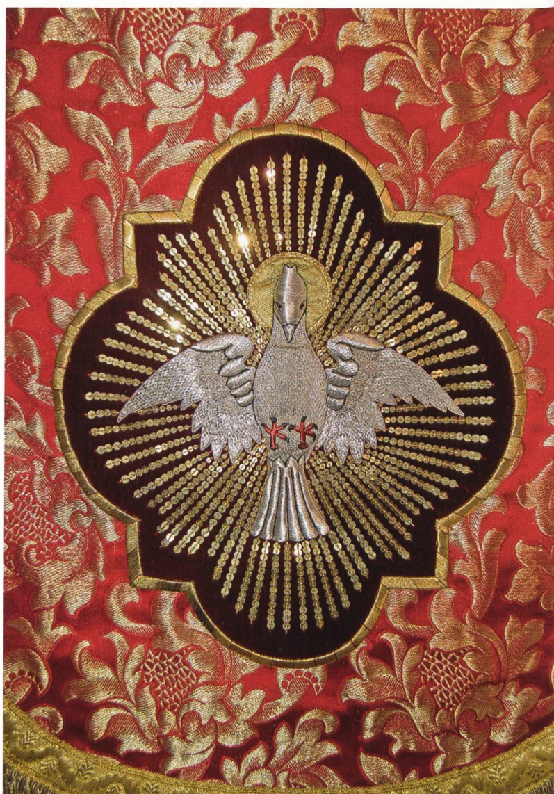
Heiliggeisttaube auf dem Mariasteiner Pfingstornat (Sakristei des Klosters).