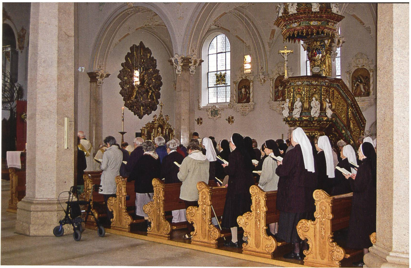
Ordenstag am 1. Mai 2014 in Mariastein: Die zahlreichen Ordensleute aus der Region Basel hatten nach dem Gottesdienst (oben) und vor dem gemeinsamen Mittagssmahl im Kreuzgang (unten) Gelegenheit, z. B. die von P. Lukas erstellte neue Ausstellung zu besuchen (siehe Bild links).