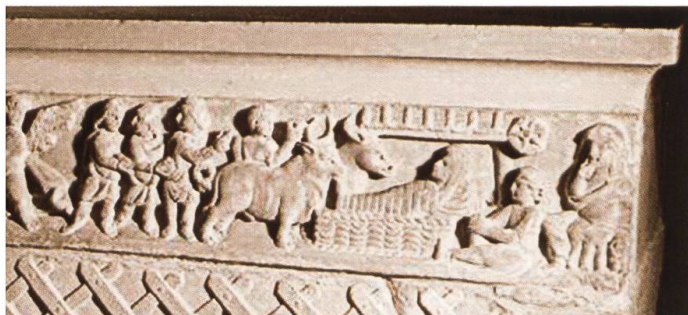
Paläochristlicher Sarkophag (4. Jh.) in Boville Ernica (Italien): Die Geburt Jesu mit Ochs und Esel, aber noch ohne Maria und Josef.

In unserem Beispiel macht sich dieser Zugang am Stichwort «Krippe» im Lukas-Evangelium fest. Welche Querverbindungen und Assoziationen weckt die Erwähnung dieses Details in der Geburtsgeschichte Jesu bei jenen, die vertraut sind mit der ganzen Heiligen Schrift, also auch mit dem Alten Testament? Es ist vor allem ein Wort vom Anfang des Jesaja-Buches, das sich da unweigerlich ins Bewusstsein drängt: