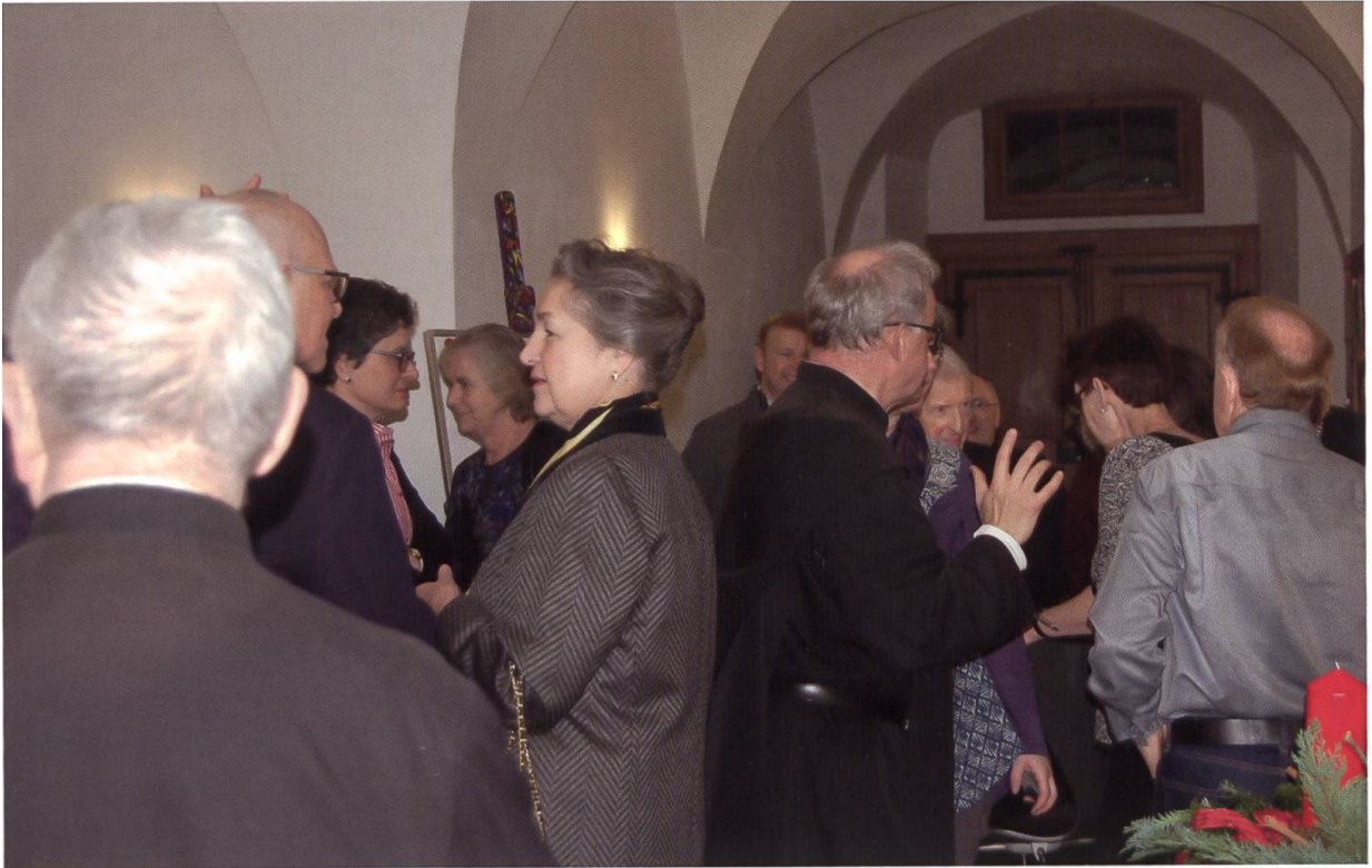
Geselliges Nachtessen mit Angestellten und ehemaligen Angestellten des Klosters am 10. Dezember 2015 im Hotel Kurhaus Kreuz.