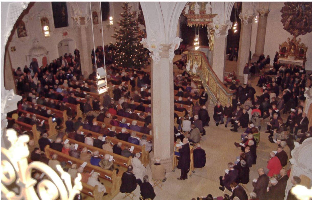
Überwältigender Andrang bei der Eröffnung der neuen Konzertreihe mit dem Neujahrskonzert am 3. Januar 2016.

tallieren konnte. Es handelt sich dabei um eine massgeschneiderte Lösung für die Bedürfnisse und Anforderungen des Mariasteiner Wallfahrtsbetriebes. P. Ludwig und P. Leonhard erhoffen sich davon eine Vereinfachung der Arbeitsabläufe und eine speditivere Bearbeitung der Anfragen und Reservierungen.