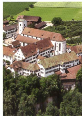
Bild- und Textband über das Kloster Mariastein