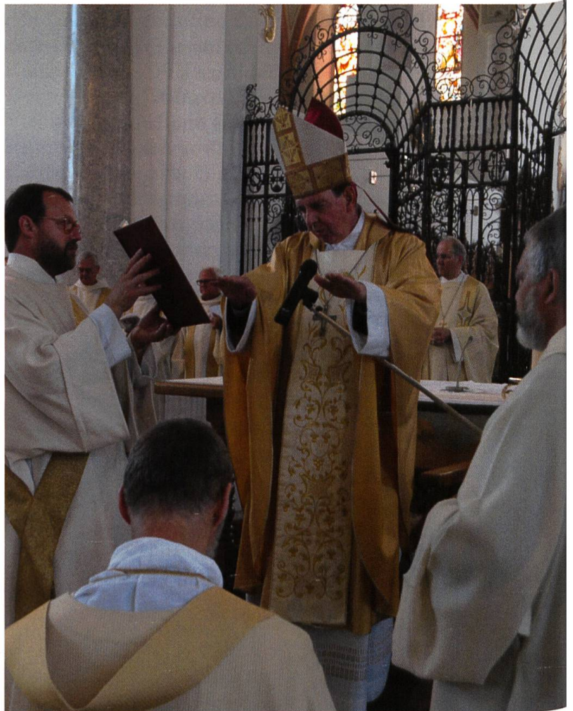
Abtsbenediktion am 5. Juli 2008: der damalige Diözesanbischof Kurt Koch segnet den neuen Abt, den die Mönche von Mariastein ein paar Wochen zuvor gewählt hatten.

Es ist ein Moment zum Innehalten und Zurückblicken, zur Standortbestimmung: Was ist gut, was ist weniger gut oder gar falsch oder überhaupt nicht gelaufen? Muss ich Korrekturen vornehmen? Doch vor allem will ich den Blick nach vorne richten: Gibt es noch Ziele, die ich erreichen, neue Vorhaben,