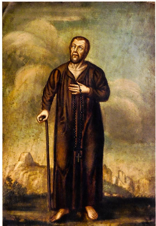
Darstellung des heiligen Bruder Klaus aus der zweiten Hälfte des 18. Jh. (im Kloster Mariastein).

Dieses Prinzip der Vermittlung, das natürlich keine Erfindung des Einsiedlers im Ranft ist, ist bis heute aktuell. Es wäre höchstaktuell in den gegenwärtigen politischen Konflikten. Doch wäre es genauso aktuell innerhalb von Familien, Ehen und Gemeinschaften. Möge das Beispiel von Bruder Klaus, dem grossen Beter, Mittler und Friedensstifter, der mit seinem Rat die Eidgenossenschaft vor einem Bürgerkrieg bewahrte, uns allen in diesem Jubiläumsjahr wieder ins Bewusstsein bringen, dass sein Rat zum Frieden und zum Auskommen untereinander und miteinander helfen kann.