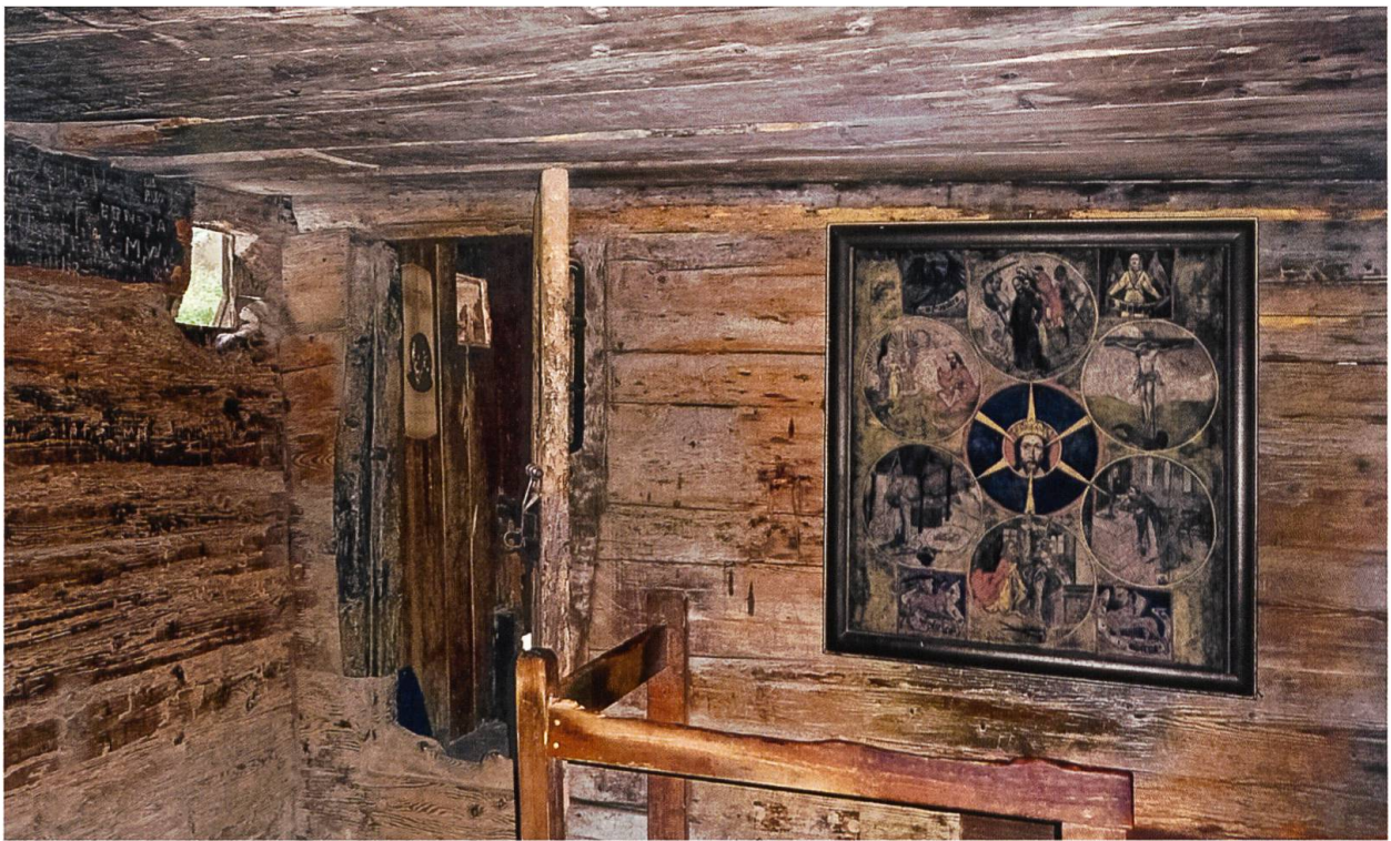
Meditationsbild des hl. Bruder Klaus in seiner Klaufe im Ranft.

te Gottes mit den Menschen, die aber zugleich mit den sogenannten leiblichen Werken der Barmherzigkeit verknüpft sind. Oben links fängt es an mit der Schöpfung und mit dem Hinweis auf Brot und Kanne, die an das Werk erinnern, Hungrige zu speisen und Durstige zu tränken. Darunter die Geburt Christi aus Maria; die dabei liegenden Wanderstab und Reisetasche deuten auf das Werk, Fremde zu beherbergen. Dann die Verkündigung an Maria durch den Engel; die Krücken verweisen auf das Werk, Kranke zu besuchen. Der das heilige Messopfer feiernde Priester, dahinter eine Totenbahre, deutet auf das Gebet für die Verstorbenen hin und auf das gute Werk, Tote zu begraben. Bei der Kreuzigung Jesu hat man ihn seiner Kleider beraubt; das dabei liegende Kleid verweist auf das Wort Jesu, Nackte zu bekleiden. Zuoberst, über dem gekrönten Antlitz Christi, ist die Szene mit dem Verrat des Judas und der Gefangennahme Jesu dargestellt, und die dabei liegende Fessel erinnert an die Weisung, zu Unrecht Gefangene zu befreien. Es sind also hier mit den biblischen Szenen Bezüge hergestellt zu den praktischen Anweisungen, wovon Jesu im Gleichnis vom Weltgericht (Mt 25, 31–