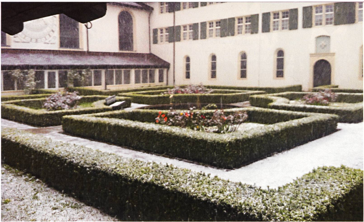
Verheerendes Vorzeichen: Schneefall im Garten des Kreuzgangs am 19. April, als alles in voller Blüte stand. Unten: Am 26. April fiel erneut Schnee rings um Mariastein. Das frische Grün an der Esche hinter den Wäscheleinen war bereits eine Woche zuvor erfroren.