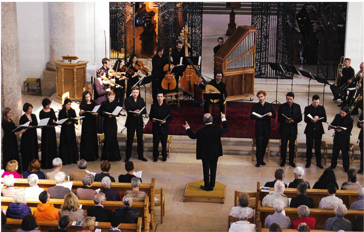
Kulturelle Anlässe in Mariastein: Ein Höhepunkt des diesjährigen Konzertzyklus war der «Vespro veneziano» mit dem Barockorchester und dem Vokalensemble La Cetra Basel unter der Leitung von Andrea Marcon am 30. April 2017 (oben). Noch bis Ende Oktober ist die Ausstellung «600 Jahre Niklaus von Flüe» im Ausstellungsraum des Klosters zu besichtigen (unten).