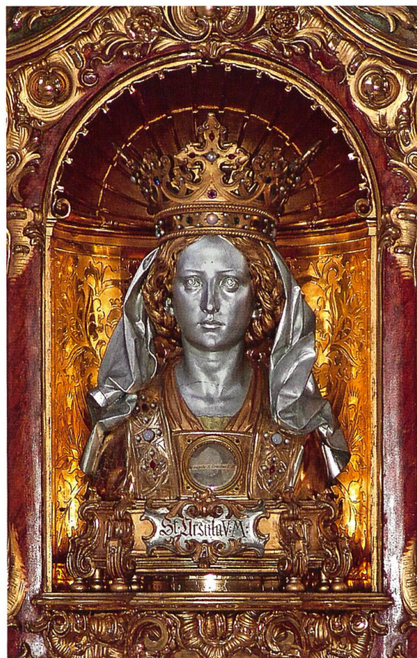
Kopfreliquiar der hl. Ursula im Ursula-Altar des linken Seitenschiffs der Basilika.

Reliquiare sind gleichsam die Gehäuse für die Reliquien. Was heute beachtet und bewundert wird, war für die damalige Zeit Nebensache. Hauptsache war und ist die Reliquie darin, nicht das kostbare und heute von der Kunstgeschichte so hoch geschätzte Auf-