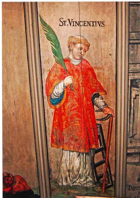
Hl. Vinzenz, Siebenschmerzen-Kapelle.