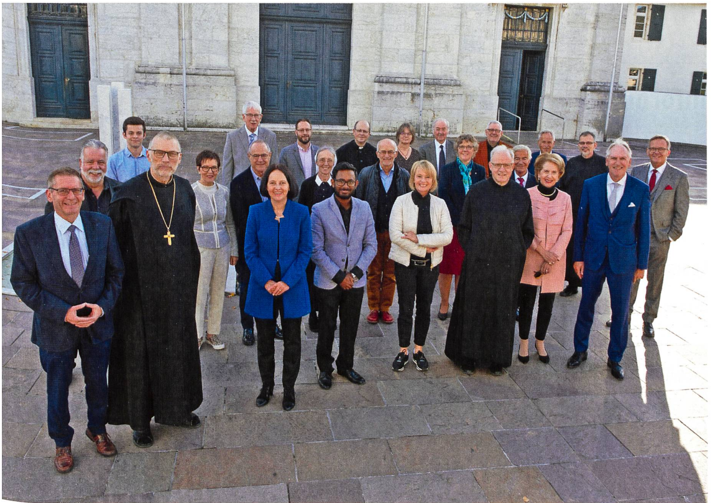
Das Patronatskomitee für das Projekt Mariastein 2025 versammelte sich am 12. Oktober 2019 in Mariastein.