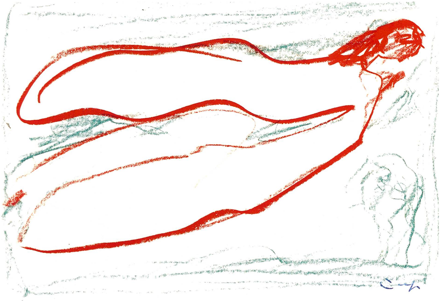
«Engel» von Eugen Bollin, 2019. Der Engelberger Benediktinermönch und Künstler bedankte sich mit dieser Skizze eines Engels für die Einladung zur Ausstellung «Aufbruch ins Weite» (Kunst aus Schweizer Klöstern) in Mariastein.

Ein Engel ist ein Gedanke Gottes. (Meister Eckhart)