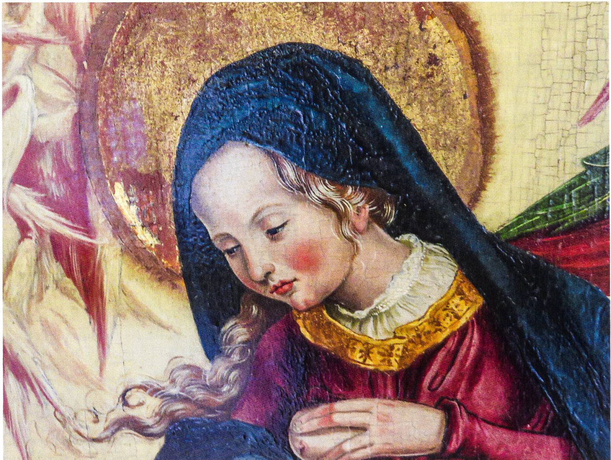
Die Feinheit und Qualität der Malerei sind erkennbar.