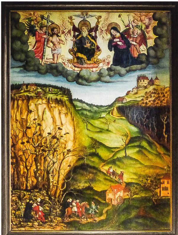
Vorderseite des Mirakelbildes aus dem Jahr 1543.