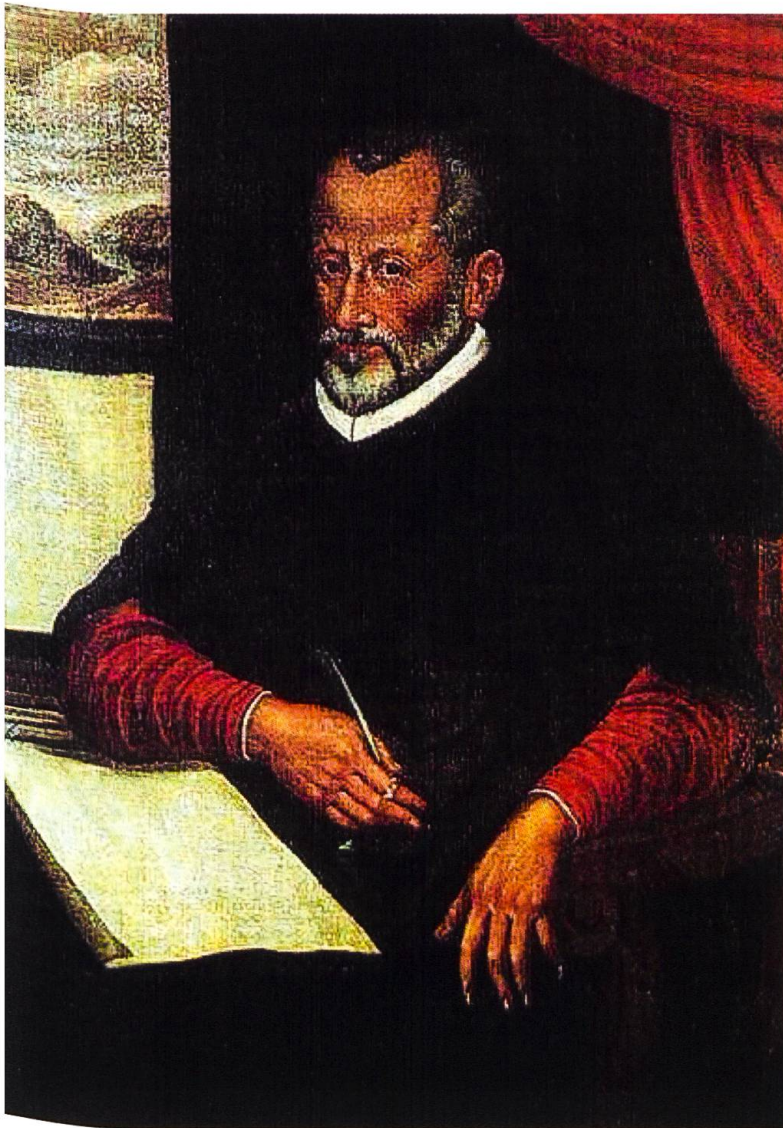
Giovanni Pierluigi da Palestrina, Italienische Schule, undatiert.

beweisen, dass Textverständlichkeit und klangvolle Polyphonie keine Gegensätze sein müssen. (Dass es tatsächlich an Palestrina lag, die kunstvolle mehrstimmige Kirchenmusik zu retten, die die Hardliner unter den Konzilsteilnehmern am liebsten aus dem Gottesdienst verbannt hätten, muss heute eher als Legende bezeichnet werden. Die Hartnäckigkeit, mit welcher diese Erzählung allerdings die Jahrhunderte überdauerte, unterstreicht jedoch die kaum zu unterschätzende Autorität seiner Kunst für die musikalische Welt des ausgehenden 16. Jahrhunderts.)