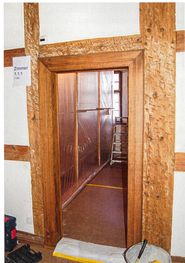
Im Konventbau werden nach 40 Jahren die Nasszellen in zwei Etappen erneuert. Die Sanierung ist anfangs Sommer 2021 abgeschlossen.