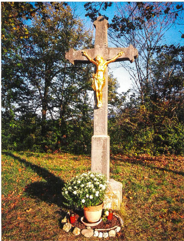
Das vor einigen Jahren zerstörte Wegkreuz am Steinrain, bei der Abzweigung zur St.-Anna-Kapelle ist restauriert und am 13. September gesegnet worden.

den können, was rege benützt wird. Ein ganz neuer Ort für das Stundengebet, und trotz des nötigen Abstands klang es sehr schön. Die Anpassungen an die Bedingungen der Zeit bringen immer wieder auch neue Formen hervor, die wohltuend sind und die von uns Anpassungsfähigkeit und Beweglichkeit fordern. Vier bis fünf Mal im Jahr gestalten wir eine besondere Rekreation (gemeinsame Erholung). Zum ersten Mal luden wir jemanden von auswärts ein: Am 16. August zeigte uns Herr Felix Beck Schwarz-Weiss-Filme, die sein Schwiegervater, René Meier, aus Metzerlen zwischen 1968 und etwa 1982 gemacht hatte. Er hatte sie bearbeitet. Viele bekannte Gesichter begegneten uns. Darunter waren auch mehrere Mitbrüder, die an Dorffesten und liturgischen Feiern wie Erstkommunion, Brunnen- und Viehsegnung mitwirkten. Aber auch Frauen und Männer aus den Dörfern Mariastein und Metzerlen, welche ja zusammen eine politische und Kirchengemeinde bilden, lachten uns aus dem Film entgegen. Es gab im Film nur frohe Gesichter, so dass es für uns auch eine wahre Freude war. Auf