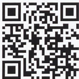
QR Code des Klosters Mariastein