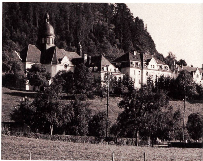
Das ehemalige St. Gallus-Stift in Bregenz.