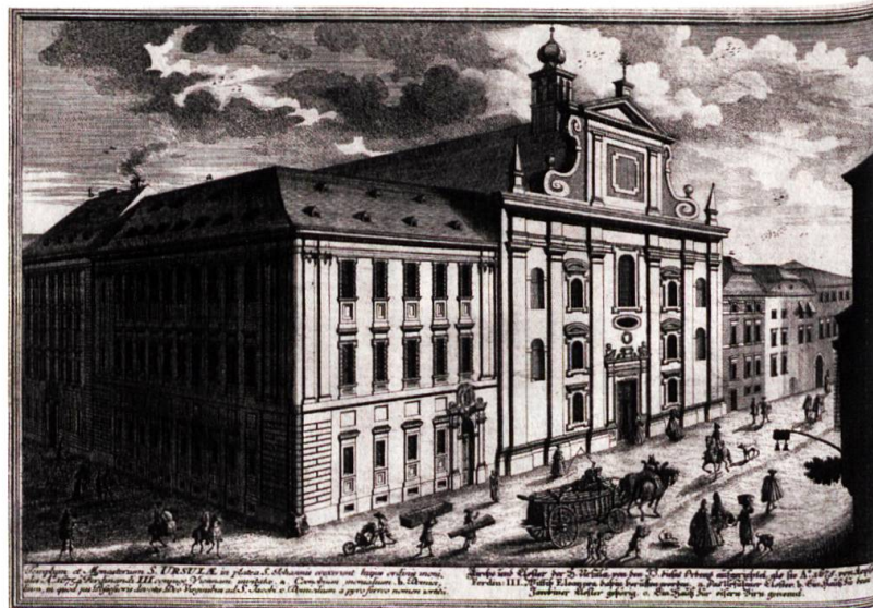
Ursulinenkloster Wien, Druckgrafik.

Das «Oratorio di Sant'Orsola» ist das vierte Oratorium Carlo Agostino Badias und das erste, das er für Wien komponierte. Es wurde am 21. Oktober 1694 im Kloster der Ursulinen, vermutlich von den Klosterfrauen selbst zusammen mit talentierten Schülerinnen, aufgeführt. Neben drei Sopran- und zwei Alt-Solistinnen gibt es auch eine Bassrolle. Das Thema der Bassistinnen, also Frauen, die eine männliche Gesangsstimmelage besitzen, in der Aufführung männlicher Rollen ist ein gleichermassen kurioses wie interessantes. Beson-