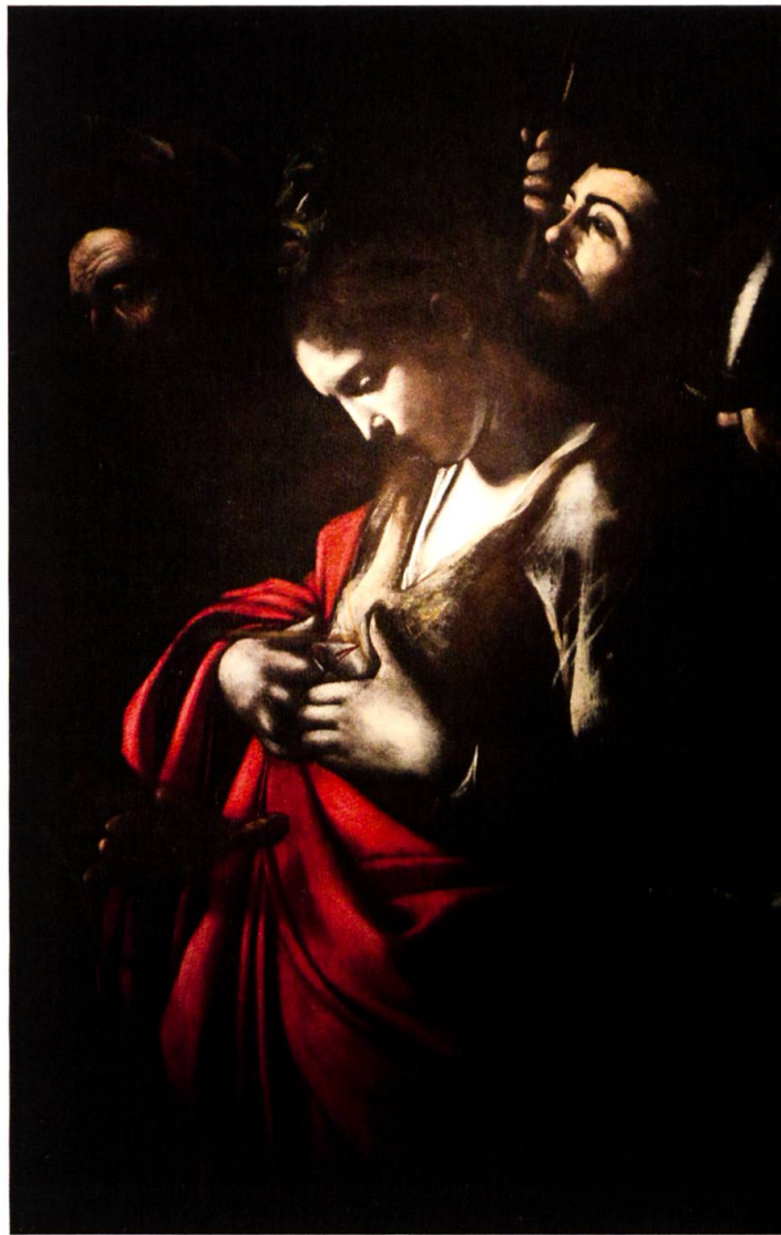
Caravaggio, Das Martyrium der hl. Ursula, 1610.