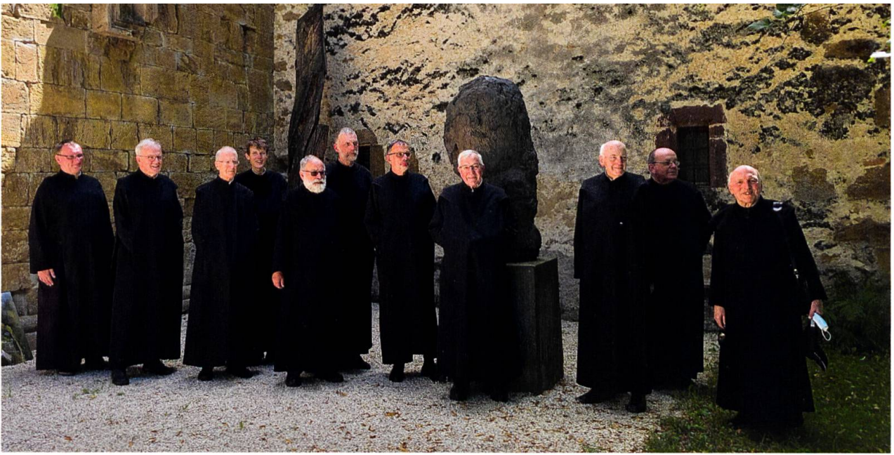
Die Mönche vor dem Kloster Schönthal, Langenbruck, am traditionellen Ausflug der Mönche und der Mitarbeitenden des Klosters Mariastein.