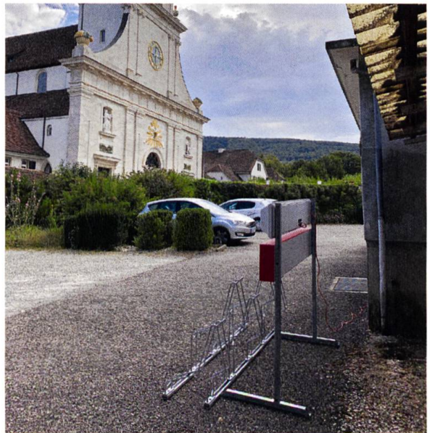
Neue E-Bike Ladestation auf dem Parkplatz des Restaurant Post, Mariastein. E-Bike-Land Nordwestschweiz, entwickelt von Baselland Tourismus, Schwarzbubenland Tourismus und Trailnet Nordwestschweiz.