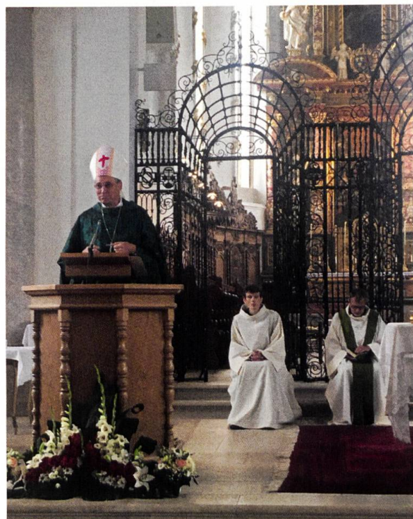
Zu Gast an der Wallfahrt nach Mariastein, Zbignevs Stankevičs, Erzbischof von Lettland.

Auch wenn der Sommer meteorologisch nicht sommerlich ist, bedeutet er doch: Ferienzeit. Die momentane Situation bewirkt, dass ältere