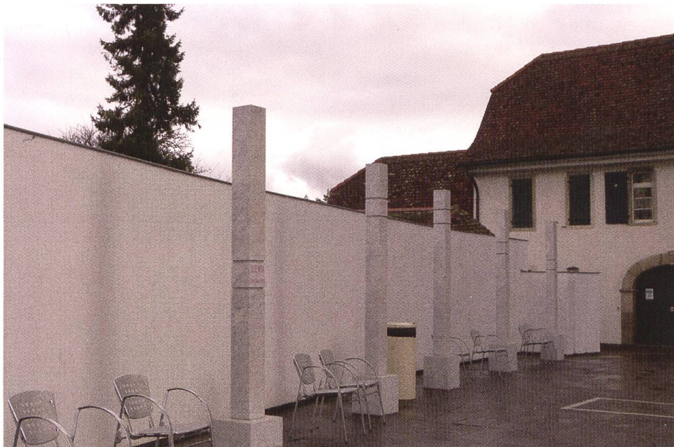
Stelen auf der linken Seite des Klostervorplatzes.

Diese sechs Geistgaben haben schon gut 2700 Jahre überdauert. Die siebte Geistgabe