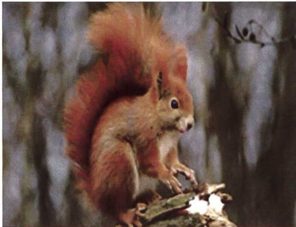
Das rote Eichhörnchen, vom Aussterben bedroht.