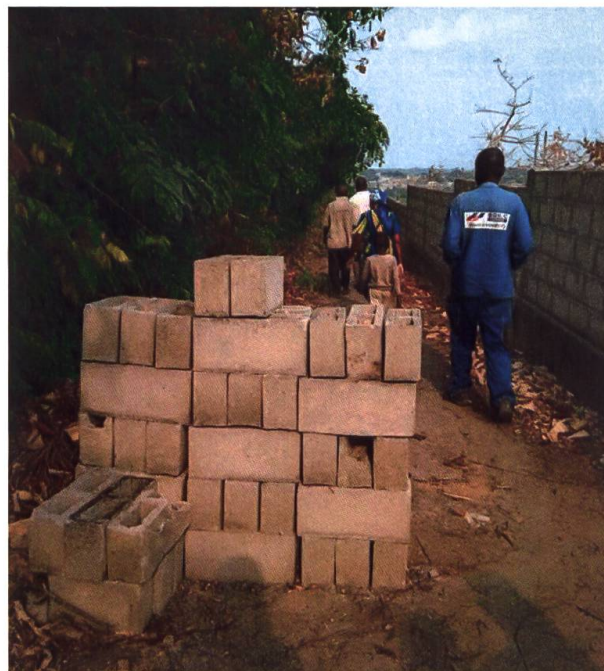
Eine Mauer schützt den botanischen Garten vor Eindringlingen und Holzfrevlern.

Ich verschränke nicht die Arme, denn ich bin überzeugt, dass die forstwirtschaftliche Biodiversität einen Schatz darstellt, den wir unbedingt schützen müssen. Die Reduzierung der Treibhausgase muss einhergehen mit dem Schutz der natürlichen Ökosysteme. Es braucht diese Reservate für die Biodiversität von Fauna und Flora. Dieses Waldstück ist ein Ort des Friedens, der noch andere Ressourcen in sich birgt. Gleichzeitig ist es von vielen Seiten bedroht, das Überleben dieses sehr besonderen Raums ist gefährdet. Doch ich bleibe zuversichtlich und hoffe auch auf jene, die diese Sei-