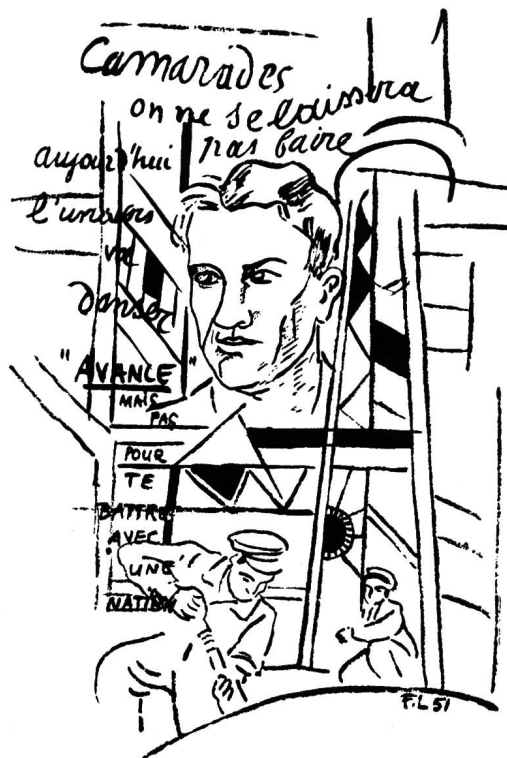
Fernand Léger, dessin pour le poème de Maïakovski «Camarades, on ne se laissera pas faire!», Les lettres françaises, 1951, n° 371. Bibliothèque cantonale et universitaire, Lausanne.

l'art soviétique, dont les reproductions ont été jusqu'alors soigneusement censurées en France 10 . Le cas de l'architecture reste à étudier de ce point de vue, mais elle n'est apparemment guère mieux lotie, sauf à se fondre dans le "grand plan stalinien" de transformation de la nature et de la ville 11 .