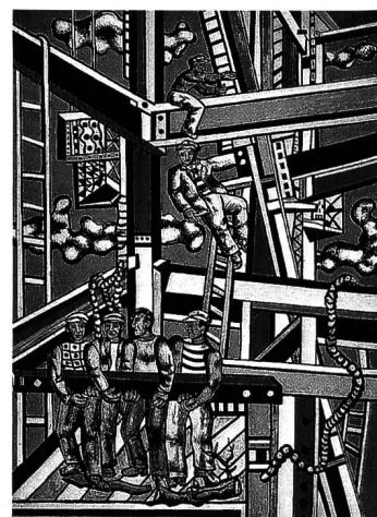
Fernand Léger, Les Constructeurs (état dit définitif), 1950, huile sur toile, 330 x 200 cm. © ProLitteris, Zürich. Musée national Fernand Léger, Biot.

Des ouvriers occupés (lâchement) au montage d'une structure métallique : considéré d'un point de vue vulgairement thématique, l'iconographie des Constructeurs est à la fois tardive (cinq ans avant sa mort) et unique dans l'œuvre de Léger. Elle est tout aussi rare dans la peinture française de ce siècle (sauf par exemple chez un Maximilien Luce), où, plus généralement, le tabou de la représentation du travail ne souffre que de rares exceptions, y compris chez les artistes restés fidèles à une esthétique du sujet : labours rural ou domestique y dominent décidément, à l'exclusion quasi totale de l'activité industrielle. Les raisons en sont multiples, à commencer par le poids de la hiérarchie traditionnelle des genres et des thèmes. L'autonomisation moderniste des valeurs formelles n'en renversera pas vraiment le principe, sinon bien sûr pour déplacer la question du sens et de la valeur du sujet.