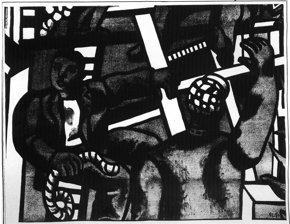
A gauche : Les Lettres françaises, 1951, n° 366, page de titre. © ProLitteris, Zürich. Bibliothèque cantonale et universitaire, Lausanne.