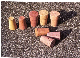
Béton pigmenté, échantillons.

Comment vous dire, en première instance, que la critique est inutile?