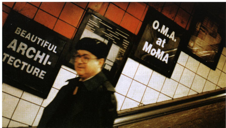
OMA au MoMA, New York, 3 novembre 1994 – 31 janvier 1995.

Ce qui a suivi peut être résumé comme une période de crise pour Koolhaas, mais de succès pour l'OMA. Le bureau est devenu célèbre et a commencé à produire d'innombrables bâtiments qui ne pouvaient plus être «gérés» par Koolhaas lui-même. Ce qu'il avait déclaré lors d'une interview donnée en 1993 – « Je suis en train de réduire la taille de mon bureau. La perspective de travailler, dans les quatre prochaines années, avec 10 ou 15 collaborateurs, plutôt qu'avec 50, me plaît beaucoup » 23 – ne se déroulera pas comme prévu. En termes d'expositions, Koolhaas s'est tourné vers une présentation de la production industrielle du bureau ( Content à Berlin et Rotterdam de 2003 à 2004).