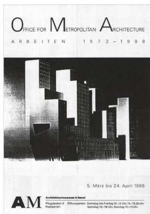
OMA Arbeiten 1972-1988, affiche de l'exposition, Architekturmuseum Bâle, 5 mars – 24 avril 1988.

OMA, The Sparkling Metropolis, Solomon R. Guggenheim Museum New York, 17 novembre – 17 décembre 1978.