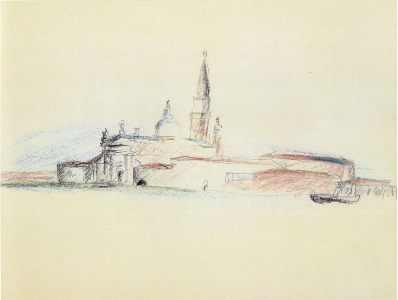
De gauche à droite : Le Corbusier, Venise, vue de l'île San Giorgio Maggiore, depuis le bateau. Crayon et pastels, 1922 ; Vue de l'île de la Giudecca depuis un bateau sur le canal, avec l'église des Gesuati (à gauche), le campa- nile de Saint-Marc et les coupoles de Santa Maria della Salute (à droite). Crayon et pastels, 1922.