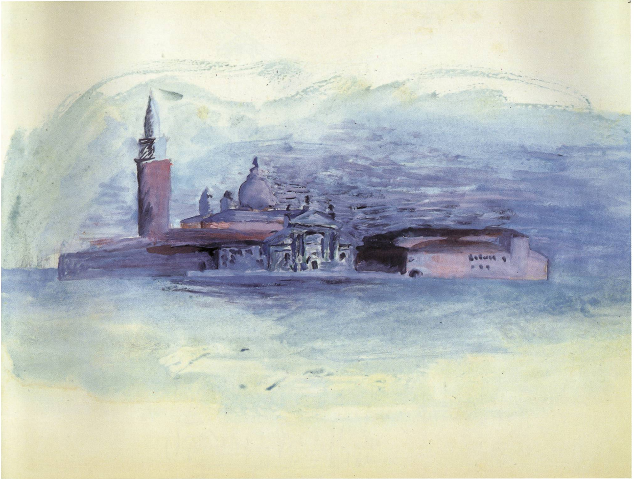
Le Corbusier, Venise, vue de l'île San Giorgio Maggiore depuis le débarcadère proche de l'actuel hôtel Monaco. Crayon et aquarelle, 1922.