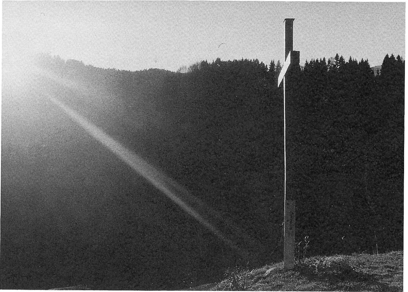
Feldkreuz (oberhalb Bräggerhof) auf dem Weg Richtung Chummen