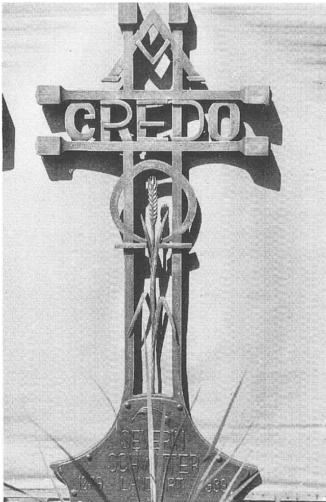
Modern anmutendes Schmiedeeisen-Grabkreuz (1939), im Sinne materialgerechter Sachlichkeit

gar nicht so weit von seinem Arbeitsplatz entfernt: in Einsiedeln. Er bekannte, dass ihn die üppigen Stukkaturen im Innern der erhabenen barocken Wallfahrtskirche immer wieder Hinweise für sein künstlerisches Tun spendeten.