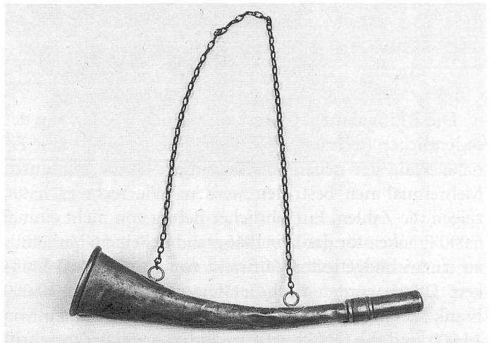
«Führhöräli» und Kirchenglocke alarmierten Mannschaft und Bevölkerung.