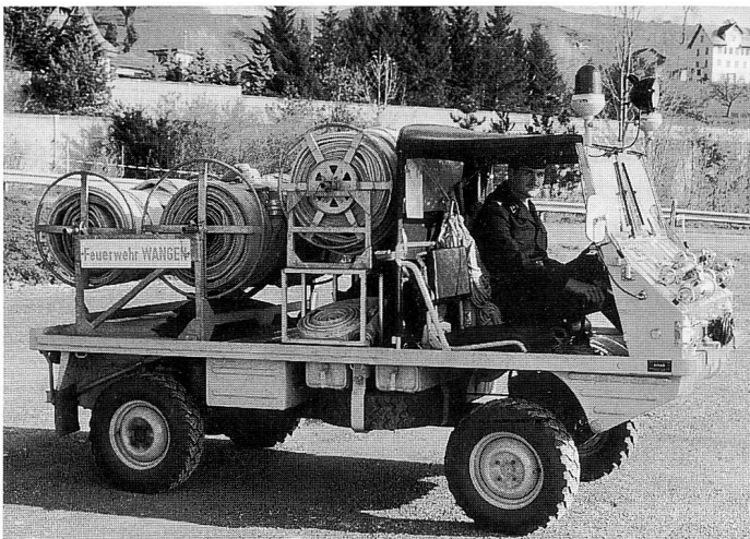
Haflinger Schlauchwagen, ab 1966.