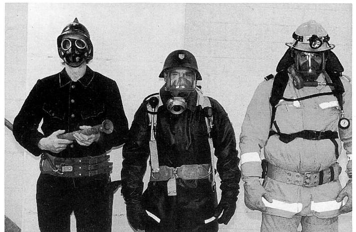
Vom Gasschutz zum Atemschutz.

Es ging bei den Erwerbungen – so sagte man – längst über die stückweise Anschaffung von kleineren Ausrüstungsgegenständen hinaus. Gerätefahrzeuge sowie eine kostspielige mechanische Leiter waren dringend notwendig. Der Ausbau eines funktionstüchtigen Gasschutzes sollte realisiert werden und erforderte grössere finanzielle Mittel. Reparaturen an bestehendem Vereinsmaterial und