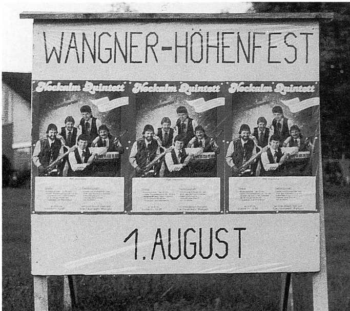
Erster von der Feuerwehr organisierter Festzeltanlass, 1. August 1991.