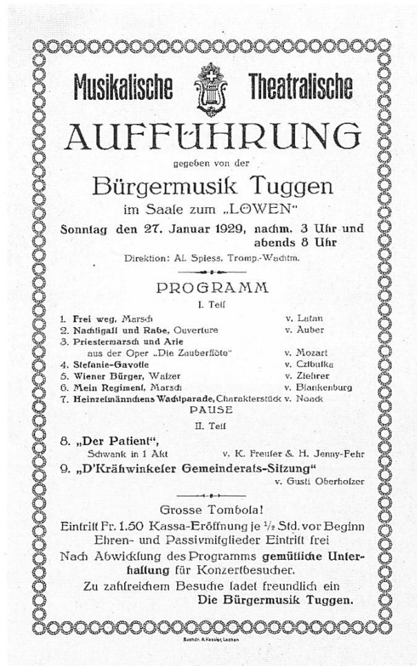
Abb. 31, Die Theatertradition wurde über lange Jahre liebend gepflegt und hochgehalten. Das Programm des Jahreskonzerts 1929 mit Musikprogramm und gar zwei Theaterstücken gibt darin Einblick.