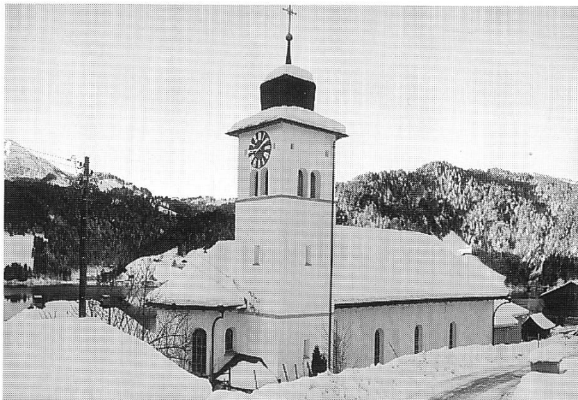
Abbildung 12: Nordfassade der neuen Pfarrkirche St. Katharina, Dezember 1996.

des Bündner Heimatschutzes im Heimatschutzheft, 1. Januar 1907. 21 Drei Dinge scheinen ihm wichtig: Der Stil, die Dekoration und der Bauplatz.