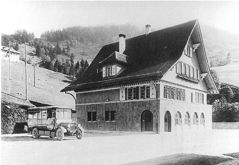
Abbildung 10: Neu-Innerthal, Gasthaus «zum Stausee» um 1926.