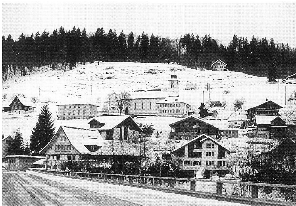
Abbildung 1: Neu-Innerthal Dezember 1996.

Erst im Frühjahr 1924 konnten die Bauarbeiten wieder aufgenommen werden und im Sommer 1924 waren die Bauten schliesslich bezugsbereit (Einweihung der Kirche 15. Mai 1924) 7 . Die Verzögerung der Baubewilligung durch die Gemeinde widerspiegelt das Misstrauen und den Widerstand der Innerthaler gegenüber der Kraftwerkgesellschaft.