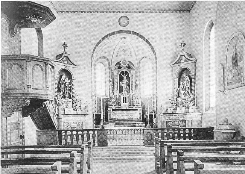
Abbildung 6: Inneres der Pfarrkirche St. Katharina um 1926.