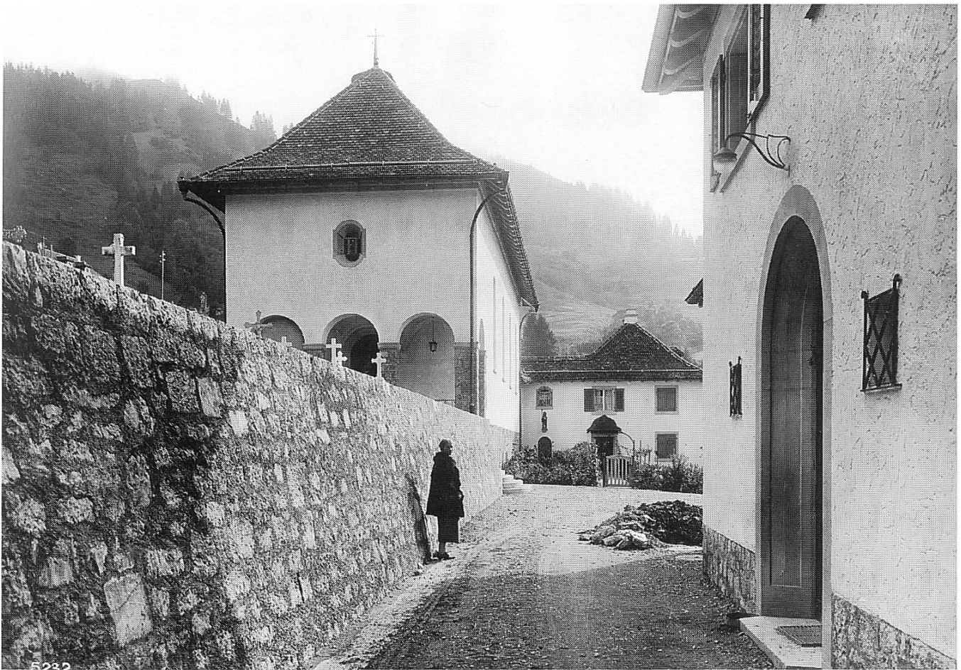
Abbildung 13: Neu-Innerthal. Blick gegen Pfarrhaus, Eingangspartie Kirche und Schulhaus um den 2. 10. 1925.