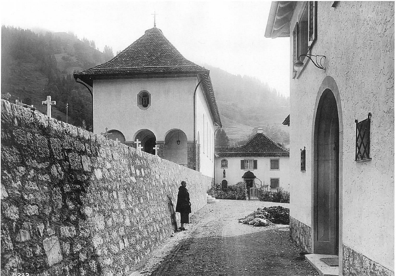
Abbildung 13: Neu-Innerthal. Blick gegen Pfarrhaus, Eingangspartie Kirche und Schulhaus um den 2. 10. 1925.