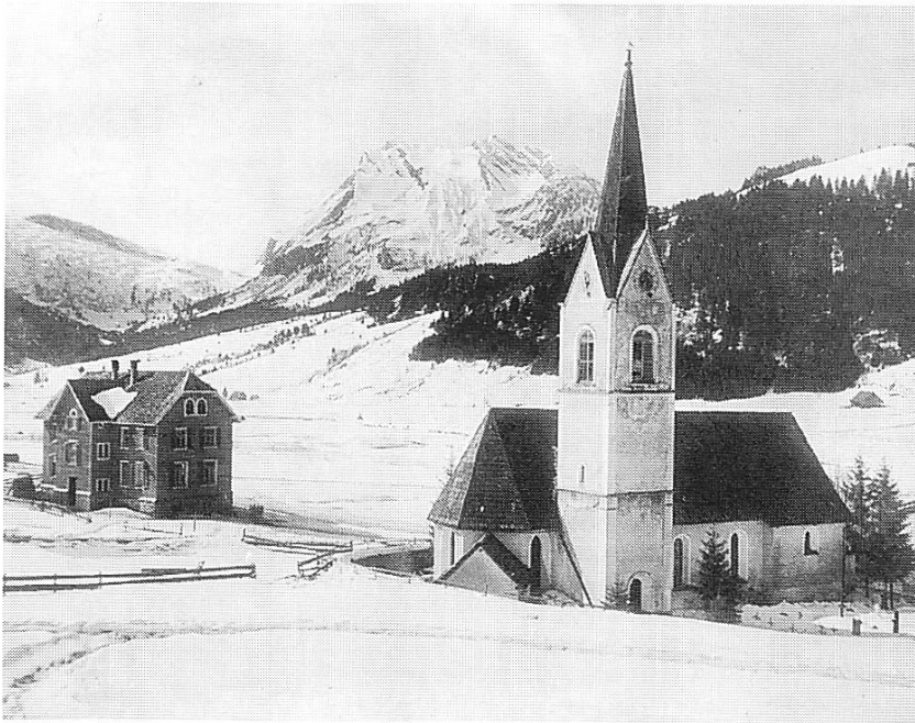
Abbildung 11: Alte Kirche von Neu-Innerthal. Seitenpartie um 1923.