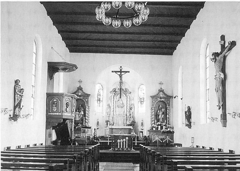
Abbildung 7: Inneres der Pfarrkirche St. Katharina, Dezember 1996.