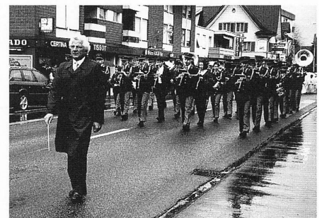
Weisser Sonntag 1996