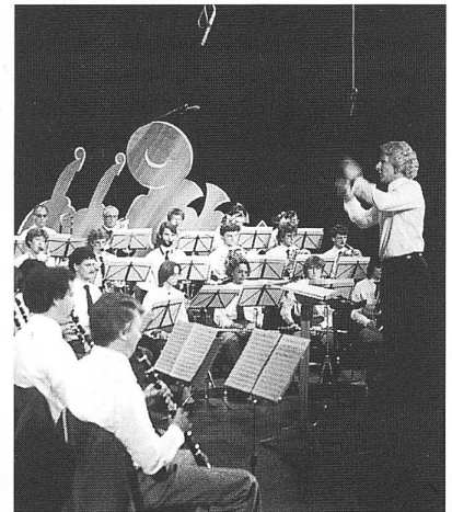
Fernsehaufnahmen zum «Concours Musica» 1985 in Zug

Alle diese glücklichen Konstellationen bildeten die Grundlage für eine erfolgreiche Entwicklung des Vereines. Im Jahre 1978 habe ich dann auch die musikalische Leitung der Jugendmusik Siebten übernommen, um die Kontinuität der Ausbildung des Vereinsnachwuchses zu garantieren. Dieser Entscheid sollte sich auch als richtig erweisen. So konnten in den darauffolgenden Jahren regelmässig junge, willige Instrumentalisten in den Verein eingebaut werden. Alle diese engagierten, jungen Doppelmitglieder trugen den zunehmend verbesserten Orchesterklang des Stammvereines in die Jugendmusik und beschleunigten die positive Entwicklung zusätzlich. Dass dabei auch der Klang der Jugendmusik entscheidend verbessert wurde, ist eine willkommene Tatsache.