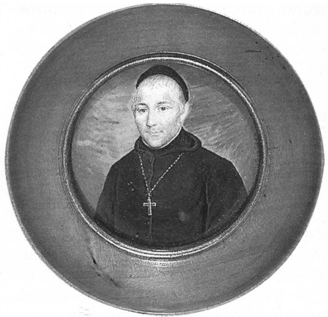
Abt Cölestin Müller von Einsiedeln (1825–1846). Ihm war «die eingebildete Herrschaft in Reichenburg» noch «viel feiler» als das vom Vorgänger dort erworbene Amtshaus.

Im Kanton Schwyz pochten die Äusseren Bezirke ab 1830 eindringlicher auf die 1814 versprochene Verfassung. Insbesondere in Einsiedeln und der March erregte die Untervertretung im Rat und in der Regierung zunehmend Anstoss. Das Alte Land aber zeigte wenig Gehör für solche Extravaganzen. Im Vorwinter 1830 fasste ein von den Märchler «Liberalen» verfasstes Memorial die Forderungen in elf Punkten zusammen. Sie wurden am 5. Dezember 1830 von der ausserordentlichen Landsgemeinde der Äusseren Bezirke einmütig verabschiedet. Der mehrheitlich altschwyzzerische Landrat aber quittierte das Begehren mit Unmut. Man hörte die Worte: Das ist Rebellion, das ist Jakobinertum! Enttäuscht boykottierten die Äusseren in der Folge den Kantonsrat, stellten Ultimaten, entwarfen eine eigene Verfassung, ja arbeiteten wie Baselland auf eine Kantonstrennung hin. Dank Absenz der Konservativen