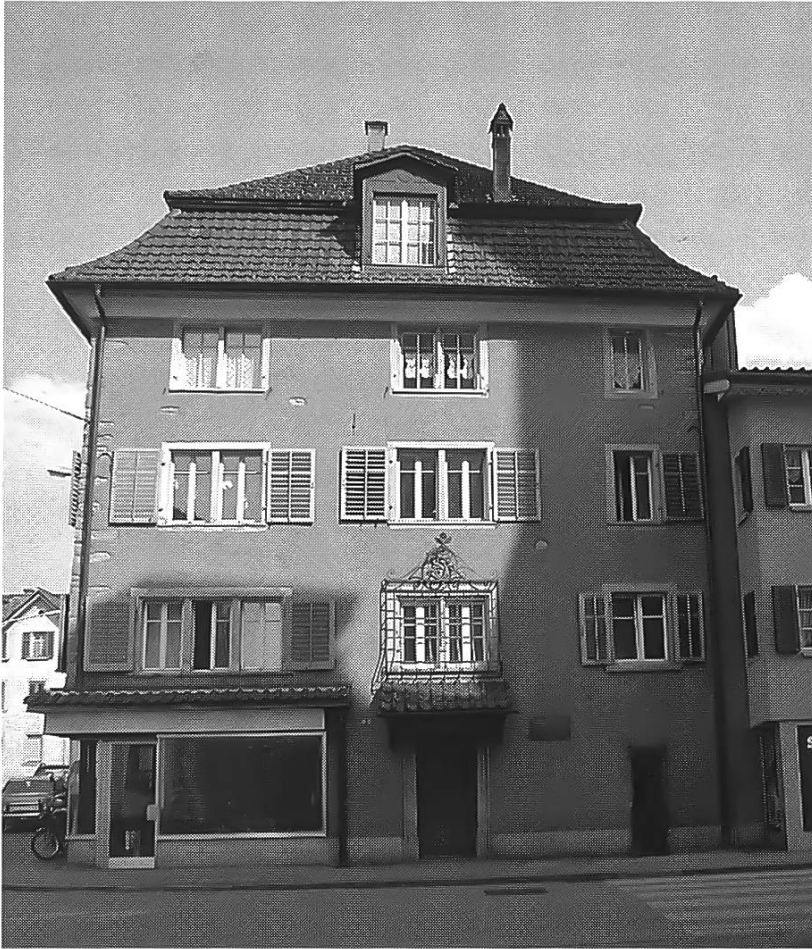
Das Gangyner-Haus am Kirchplatz 6 in Lachen. Erbaut gegen Ende des 18. Jahrhunderts.